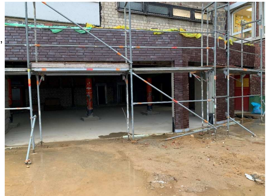
OGS Erweiterung im Untergeschoss